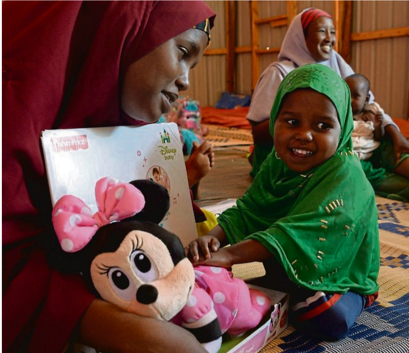
An der Universität Kassel wird an einem neuen Zentrum zur Entwicklungszusammenarbeit und den globalen Nord-Süd-Beziehungen geforscht.

Das „Global Partnership Network“ (GPN) ist ein Forschungszentrum, an dem 12 Universitäten und 20 Nichtregierungsorganisationen weltweit beteiligt sind. Es wird über das sogenannte Exceed-Programm („Hochschulzellen in der Entwicklungszusammenarbeit“) des Deutschen Akademischen Austauschdiensts gefördert. Das GPN ist neben dem International Center for Development and Decent Work (ICDD), das über zehn Jahre gefördert worden ist, bereits das zweite Exceed-Zentrum, das an der Universität Kassel angesiedelt ist. rud